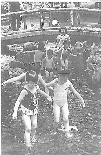
上: かもしか組さん(5歳児)共同製作の「こいのぼり」が、5月の空に泳ぎます。陽光保育園屋上で 左: 春の親子バス園外保育は丸山公園(上尾市)。水場で遊び、大喜びの子どもたち 下: 園庭の砂場で泥んこ遊びのあと、ビニールの簡易タライで洗濯に興じる3歳児の子どもたち