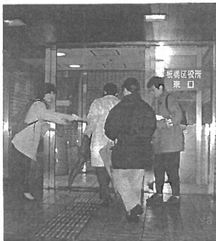
補助金カット反対を訴えて、区役所前でピラ配りをする私立保育園の保母

近年少子化が進むなか、私立保育園での定員未充足対策は運営の大きな課題となっています。というのも、私立保育園では児童福祉法のもと、板橋区の委託を受けて措置児(保育に欠ける児童)を預り、保育の仕事をしていきます。その運営費は国・都・区からの措置費と補助金で賄われています。保育所における最低基準にもとづいて定員や職員の配置が決められ、措置費は毎月一日に於ける在籍数で支払われます。そのため、定員に欠員があると運営が不安定になり、保育内容や職員の安定した雇用が不可能になります。そこで、私立保育園のたつての要望を受け、板橋区は未充足対策のための「実施要綱」を作り、未充足対策費を支払い、保育内容の充実をはかってきました。ところが突然、新年早々の年度途中