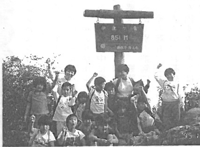
伊豆ヶ岳登山したかもしが組(5歳児)。山頂でみんなニコニコ11/14