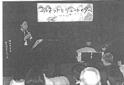
後援会主催のコルネットとリユートのゆうべ(3/2)。みんなうっとり