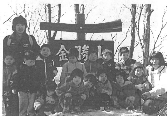
落葉と雪を踏みしめて登った金勝山。みんな顔が輝いている

とんぼ組(三歳児)二回目の山登りは、二月二日、金勝山(東武竹沢駅下車)に行ってきました。大雪の後ということで心配しましたが、当日は青空が広がって暖かい日になりました。日陰には雪が残っていて、まるで雪