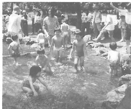
▲初夏の陽気の中、水浴びに歓声が上がる

保問協、児童部長等と会見 去る五月二十九日、板橋保育問題協議会(保問協)では、区の児童部長、児童課長、保育課長、係長二名との会見を行いました。