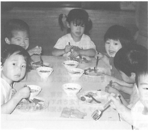
▲給食の時もワイワイとおしゃべりがはずむ

休み明けの月曜日は特ににぎやかな。休みにゆったりと家族と過ごした後の友達との再会は、また嬉しいものです。「昨日何してたの?」「どこか行ってきた?」ときくと、「あのねMね!」「Sは!」とみんな話をきいてほしくていっぺんにしゃべり始め、順番にきくのが大変なくらい。「交通公園行ったの」「Rちゃんも遊んだ」等かわいなおしゃべり。「大山に買物行ったの」と一人が言うと、「買物行った」と何人も続いたり、「何を買った」の話から「冷蔵庫にチーズがあるんだ」「うちにね、うさぎの形のチーズあるよ」「うちにはバナナが入ってるよ」と会話と思わぬ方向へ進んでいったり、「お父さんとお母さんとデイズニerlandに行ったんだ」と一人が言うと、「行ったこと