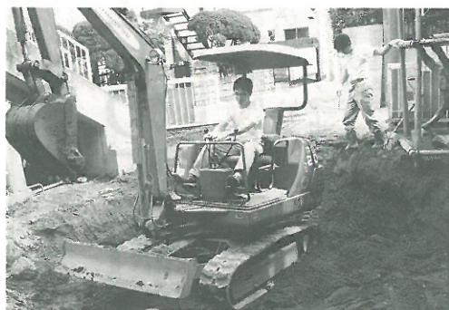
▲5月5日、砂場の砂を入れかえました

新入園児18名と進級児59名の明るく元気な子供たちと職員28名で新しい年度をスタートしました。 新入園児の中の6名は0歳児、いちばん小さな子供は生後わずか3ヶ月余りです。入園式にはお母さんの腕にそっと抱かれていた赤ちゃんも、わずか2ヶ月余の保育園生活の中で、腹ばいになり手足を大きく広げ、日に日に瞳の輝きを増しています。どんなに年齢が小さくても、自分の手で、足で、目で、しっかり確かめ体験して、力をつけ、育っていく子供たち。 5月5日：子供の日。陽光保育園自慢の砂場が3年振りに生まれ変わりました。4トン車4台分の砂。2人の若者が朝から夕方まで、精一杯動いてくれました。子供たちの砂遊びがますます生き生きと活発になったように思える今日この頃の保育園です。