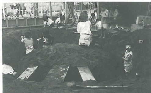
▲子どもたちはみんな、砂場で遊ぶのが大好きです

「先生、中の階段もきれいになってよかったですね」とお母さん。「ええ、赤ちゃんがハイハイしたりするのでね、この際思い切ってしっかりした木材を使ってもらいました」と私(園長)。「屋根も相当傷んでいたので、今回は良質の塗料で奮発して仕上げましたよ」と共立工業(施工業者)の専務さん。「おかげさまで働きやすくなりました」と調理の職員。 この度の園舎大規模修繕、保育をしながらの工事でしたので、ご近所の方にもご迷惑をおかけしたかと思いますが、お陰様で無事、昨年の暮れに完了いたしました。 いろいろな形で応援に感謝しています。