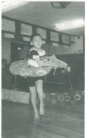
踊ります。自分たちの荒馬に明るい未来を託し、野山を自由に駆けまわる馬のように精いっぱい、踊り跳ねるのです。 (九二年度五歳児担任 大沢美鈴)