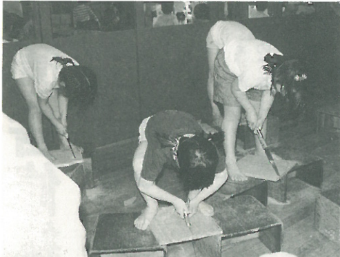
▲上=絞り染め、ワクワクしながら糸を抜きます 下=板を馬の頭の形に切り抜いていく子どもたち

きます。不思議と、「できないよ」とか「やりたくないよ」と言う子はひとりもいません。みんな自分の馬が少しずつ出来上がっていく喜びの方が大きいようです。